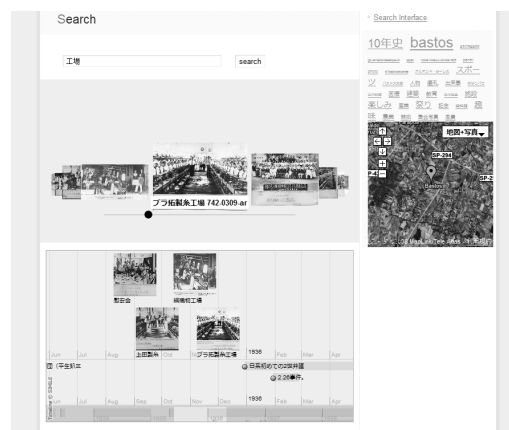
図1 ブラジル移民アーカイブサイト

本研究は、歴史的資料のデジタルアーカイブ構築を目的としたシステムの一部として検討と実装を行ってきた。近年、Web 上のサービスとして、Flickr[4] や